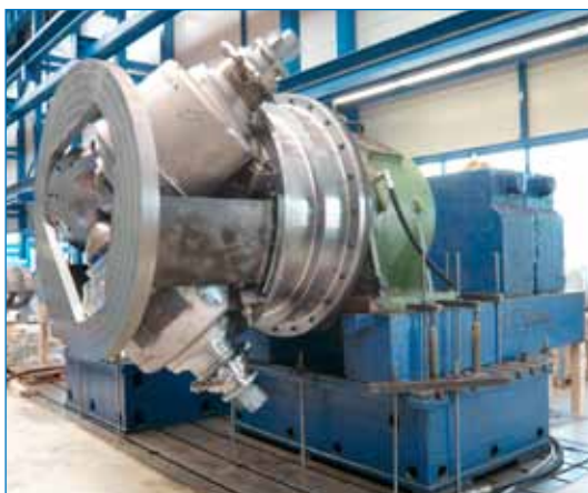
La cage du laminoir planétaire à l'atelier de SMS Meer

Après des années de production sans arrêts notoires ni défauts de qualité, une révision générale du laminoir a été validée en 2009 afin de continuer à assurer une production fiable et rentable. Pour évaluer les possibilités de maintenance et de réparation, BGH Freital GmbH a fait appel au SAV de SMS Meer,