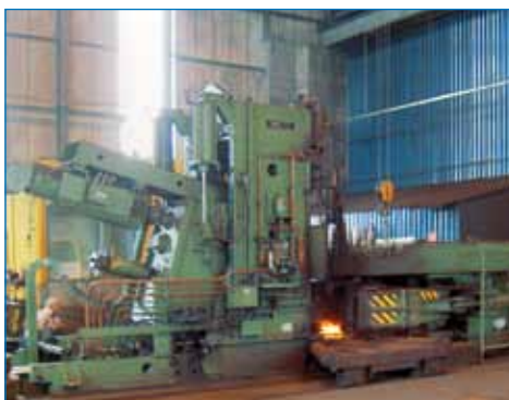
Laminoir circulaire RAW 125/10

La nouvelle commande améliore le niveau de qualité des produits et contient en outre des fonctionnalités qui ne sont pas dis-