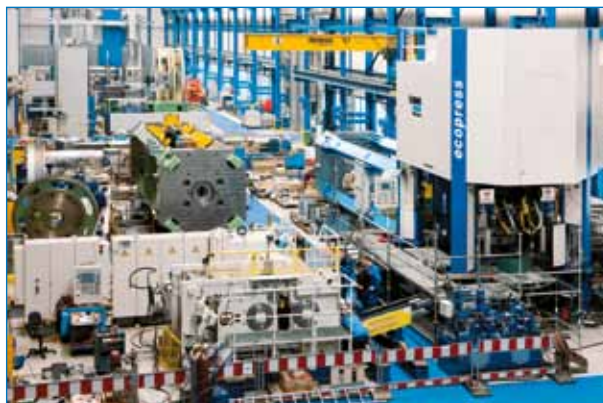
Vue du haut dans l'atelier de fabrication

Par l'extension continue de notre parc de machines, nous avons renforcé considérablement nos capacités d'usinage. Nous pouvons ainsi réagir rapidement et de manière flexible aux exigences des clients, aussi spécifiques