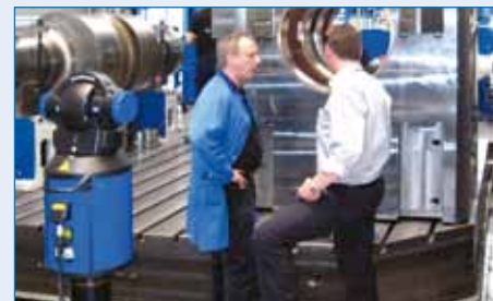
Mesure de composants

SMS Meer mise sur des techniques et procédés d'avenir. Un nouveau système de mesure laser portable en 3D permet de relever les axes et géométries des machines en un minimum de temps. Que ce soit en neuf ou en réparation, les résultats de mesure sont directement disponibles. La précision est de 0,015 mm à une distance pouvant atteindre 35 m.