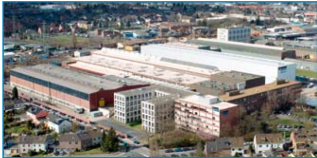
Enceinte de l'usine de SMS Meer GmbH Mönchengladbach

La forte demande mondiale dans le secteur de la construction d'installations et de machines provoque des goulots d'étranglement considérables de fourniture dans bien des domaines. La conjoncture exceptionnelle dans la construction des installations métallurgiques, persistant maintenant depuis quatre ans déjà, va se poursuivre aussi en 2008.