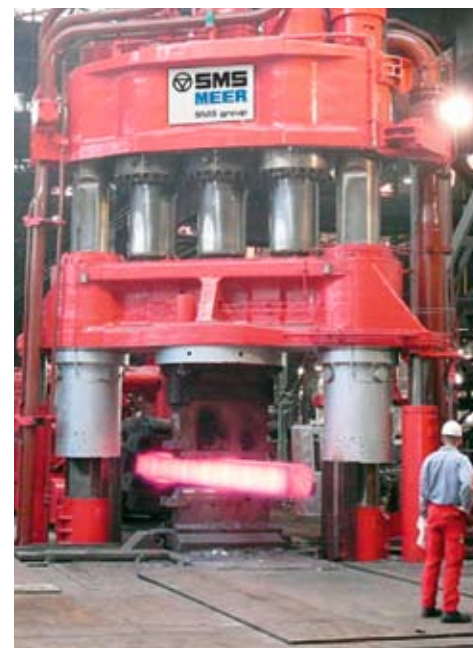
Presse de forgeage libre après remise en état et modernisation

Après une analyse coûts-avantages, nous avons défini l'étendue exacte des prestations et le déroulement du projet pour les travaux de réparation à réaliser. Parallèlement, les experts de SMS Meer ont lancé l'approvisionnement des pièces de réserve afin de réduire les dé-