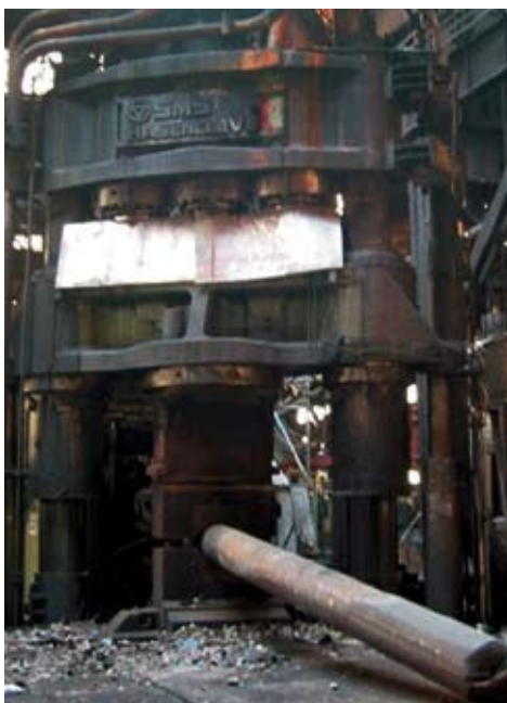
Etat de la presse de forgeage libre après l'incendie

A cet effet, nous avons mis au point des concepts techniques et économiques en étroite collaboration avec le client, naturellement avec prise en compte